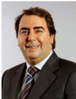
Carlos Negreira Presidente do Eixo Atlántico Alcalde de A Coruña