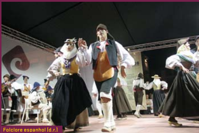
Folclore español (d.r.)

Cos espectáculos sempre pola noite, o festival contará coa participación de varias bandas, das cales podemos destacar os coñecidos Traballadores do Comércio (na foto).