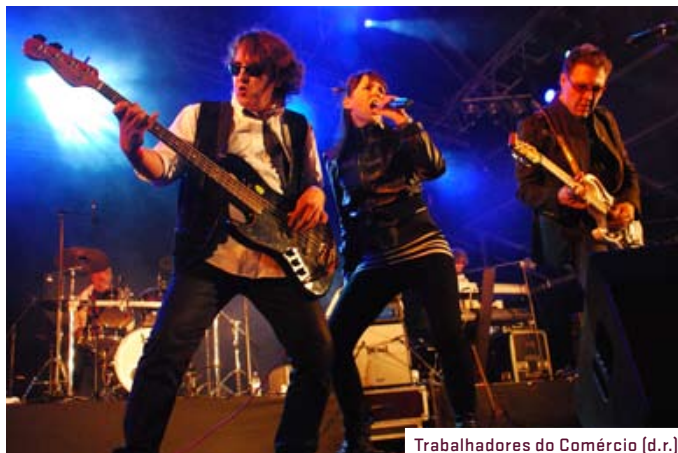
Trabalhadores do Comércio

Com espectáculos sempre à noite, o festival conta com a participação de várias bandas das quais se destacam os conhecidos Trabalhadores do Comércio (na foto).