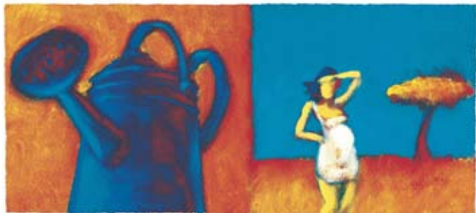
“A Vida Numa Colher - Beterraba” de Miguel Rocha

A chamada “9ª arte” vai ter um espaço próprio nesta Capital da Cultura do Eixo Atlântico, que servirá de fórum para profissionais e apaixonados ao longo de todo o mês de Agosto.