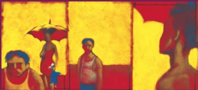
“A Vida Numa Colher - Beterraba” de Miguel Rocha

A chamada “9ª arte” vai a ter un espazo propio nesta Capital da Cultura do Eixo Atlántico, que servirá de fórum para os profesionais e apaixonados ó longo de todo o mes de agosto.