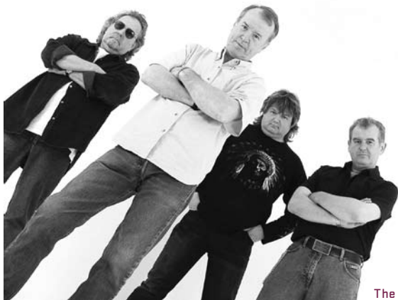
The Animals

A música de diferentes géneros mas com grandes nomes garante três noites de espectáculos de qualidade no primeiro fim-de-semana da “Capital da Cultura”, todos eles com acesso gratuito.